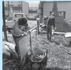
豪雨で溜まった土砂や物を丁寧に撤去します。