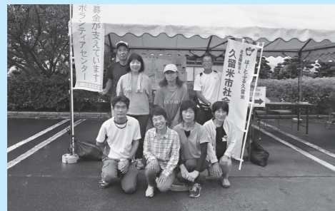
今回参加された皆さんです

令和5年7月豪雨により久留米市で被災された人を支援するため、今回の呼びかけで参加された町民8名と作業してきました。「人吉球磨が被災した時も全国から応援してもらった。今回はそのお返しになればと思い参加しました。」と、敷地内に堆積した土砂の撤去搬出や、敷地内の不燃物や可燃物の搬出など、途中夕立に見舞われず濡れの中でも1日の作業に汗を流すボランティア皆さんの笑顔が輝いていたのが、とても印象的でした。