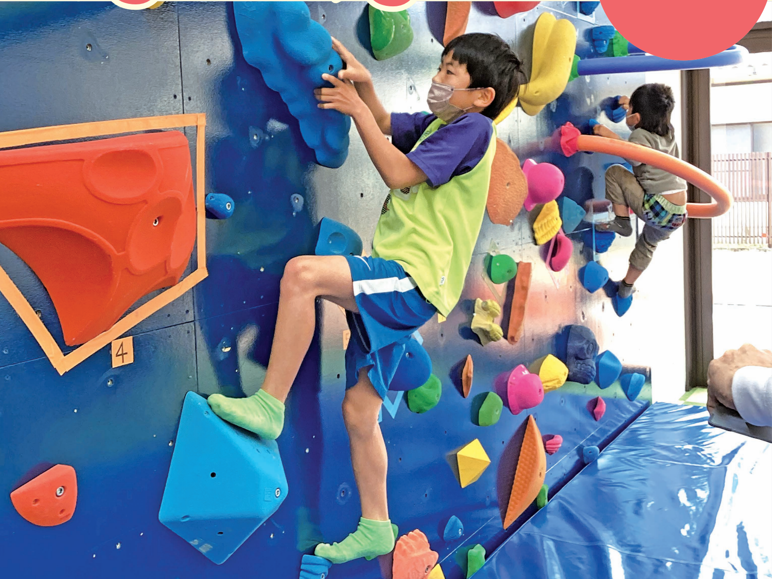
ボルダリング大会の様子

令和5年3月19日(日)にふれあい福祉センター『かえで館』において、センターの利用促進を目的としたイベントを開催しました。当日、センター内に常設されているボルダリングコーナーで5歳から6年生を対象としたボルダリング大会が行われ、多くの参加者で賑わいました。